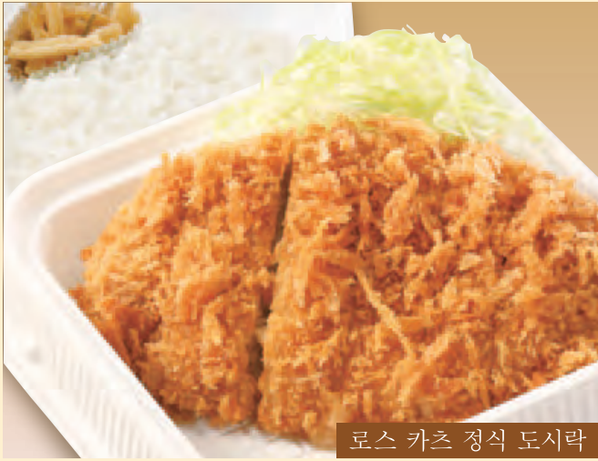
로스 카츠 정식 도시락