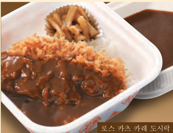
로스 카츠 카레 도시락